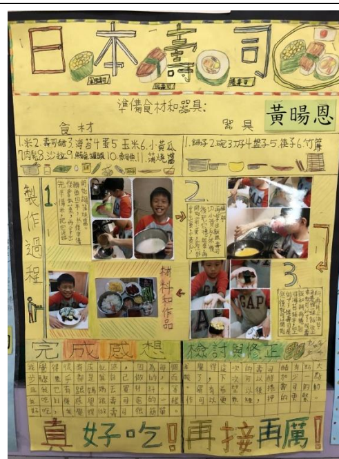
◆優秀廚師製成一道餐品的製作方法、步驟與媽媽同心製作的感想。