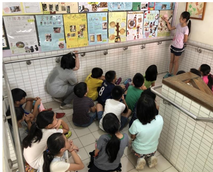
◆讓學生發表自己的優良作品。