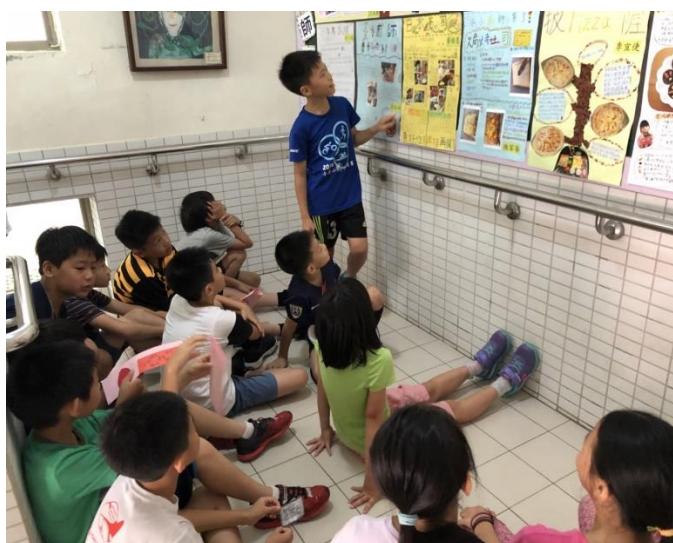
◆讓學生發表自己的優良作品。