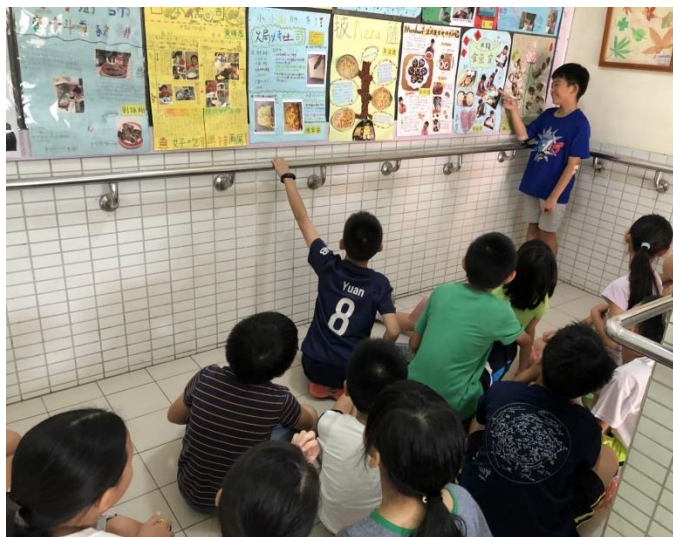
◆讓學生發表自己的優良作品。