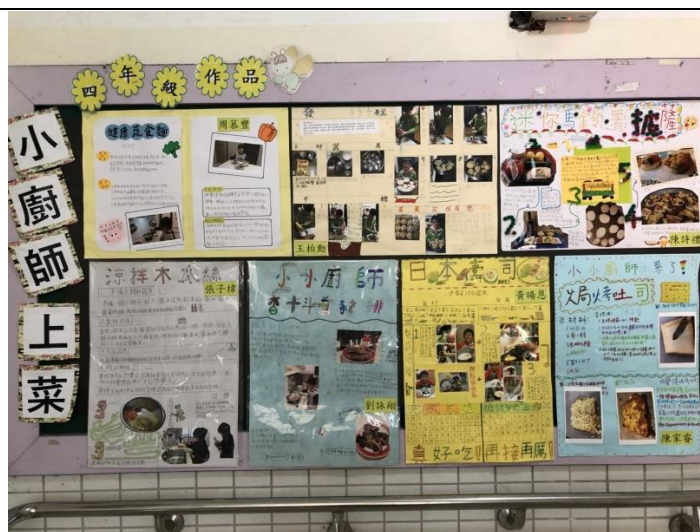
◆小廚師的菜單展示區。