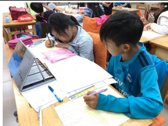
◆(照片說明)將創作的新詩抄寫在卡片上