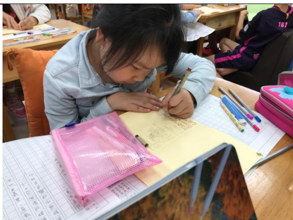
◆(照片說明)認真的書寫再用漂亮顏色的原子筆描過一遍