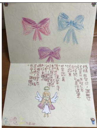
◆(照片說明)圖文並茂的作品