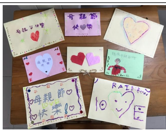
◆(照片說明)每個人的卡片都很有特色！