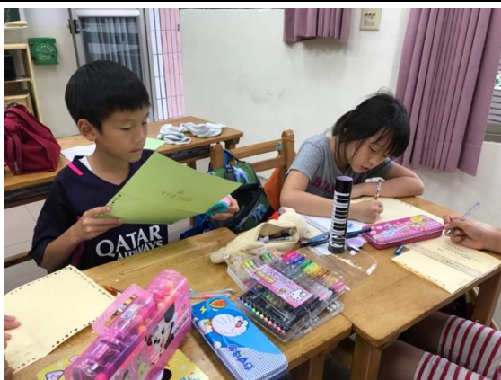
◆(照片說明)用心設計自己的母親節卡片

◆省思與回饋：新詩創作的過程中，孩子透過想像力，聯想母親在生活中所扮演的各式角色，體認到母親對自己無私的愛及付出是無比珍貴的，也給予孩子多一種機會表達自己的愛與感謝。孩子也在全神貫注的製作完手工卡片後更有成就感了！