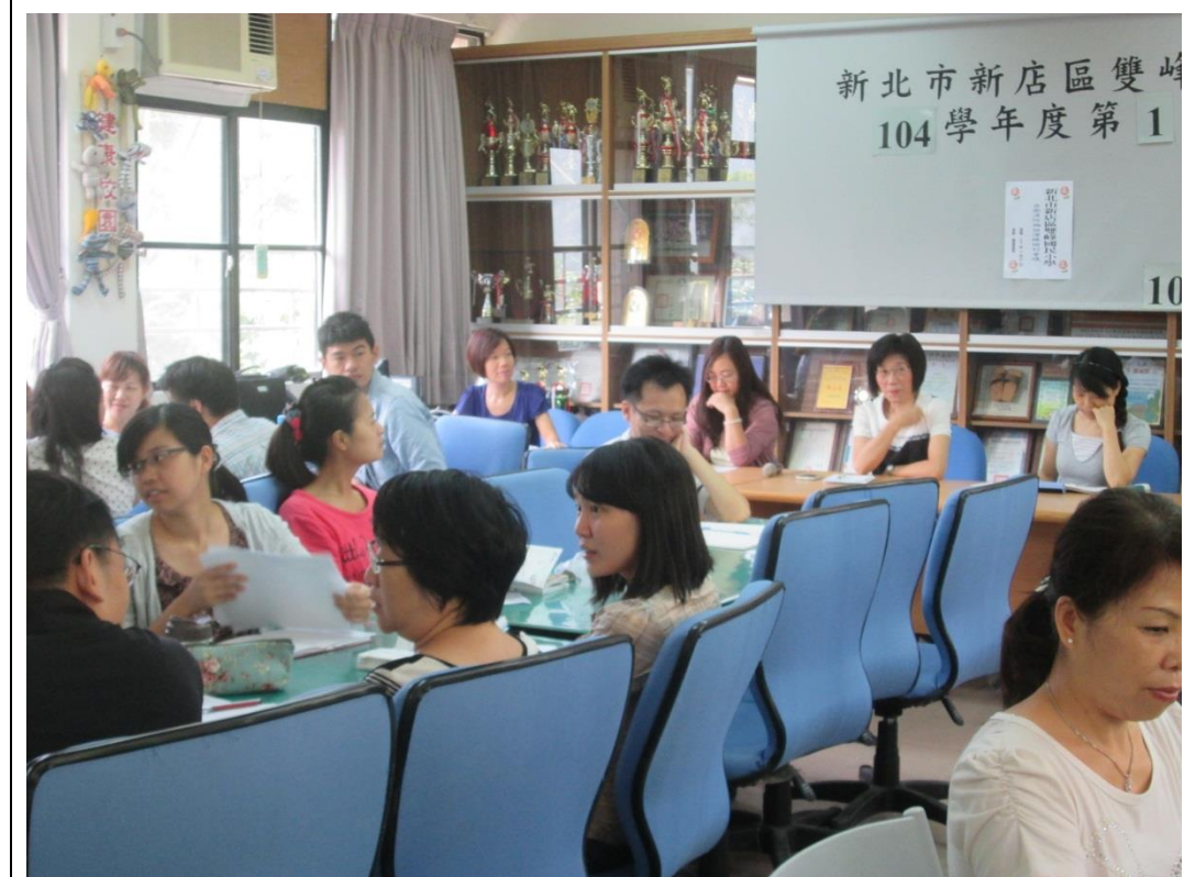
照片說明:全體教職員工 針對演練情形提出建議