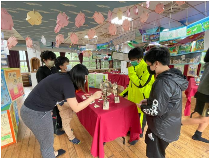
學生向師長解說自己展覽的作品