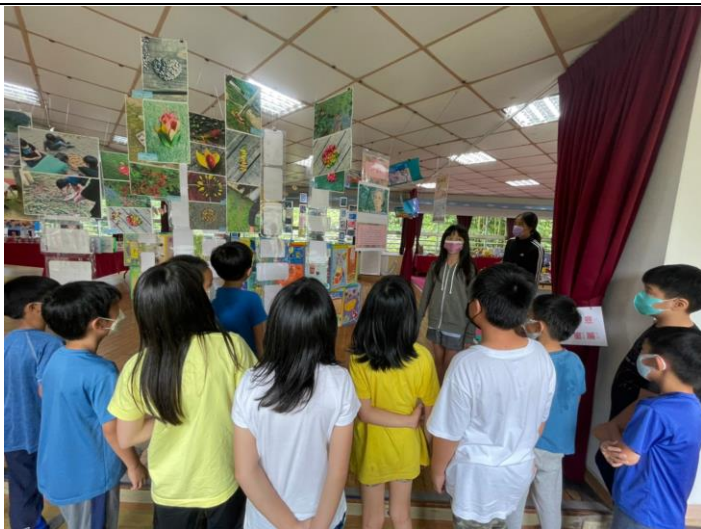
學弟妹前來多功能教室進行參觀學長姊的作品