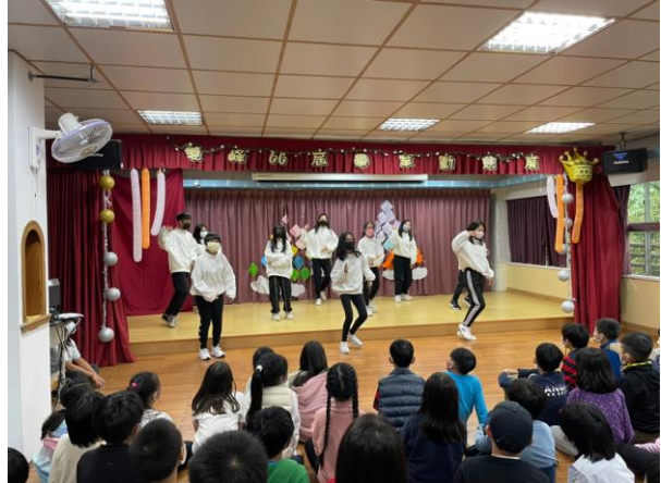
畢業生進行舞蹈表演