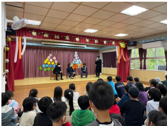
畢業生進行戲劇表演