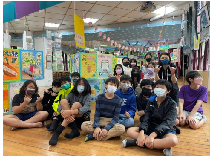
與自己親手佈置完成的展覽進行合影