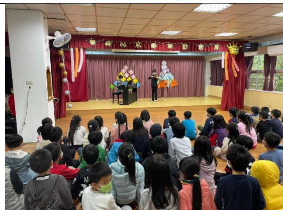
畢業生進行音樂演奏表演