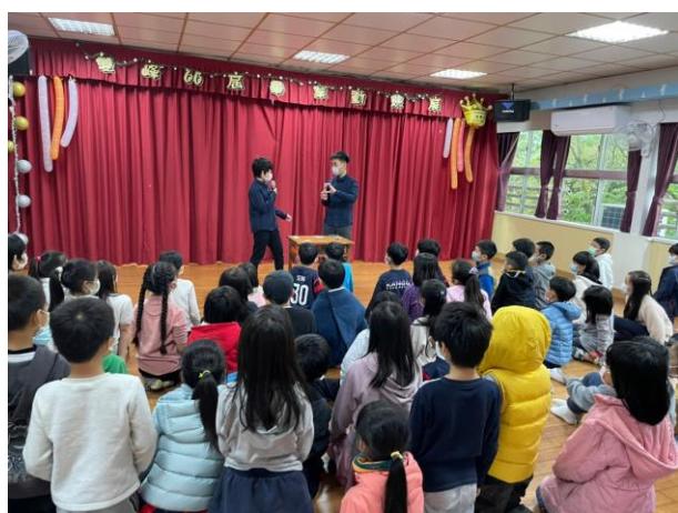
畢業生進行魔術表演