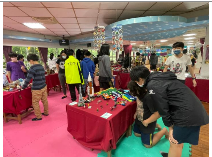
透過參觀同儕的作品並給予同儕正向的回饋