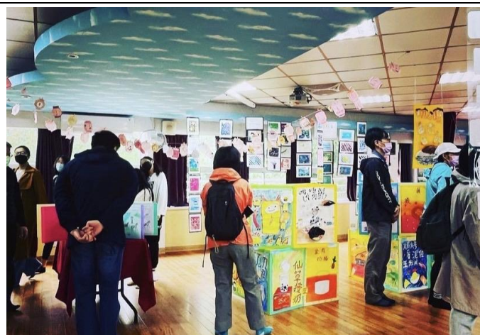
家長蒞校參觀孩子六年來在雙峰的學習成果，給予孩子最大的回饋與動力。