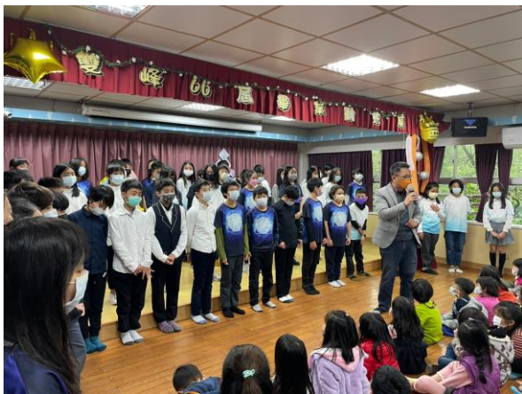
校長欣賞完展演給予畢業班的親師生回饋

第 66 屆畢業生與班導師與家長的努力下，讓全校親師生欣賞畢業生學習的成果，成為來觀展的學弟妹的典範，在欣賞之餘，也能有所收穫。