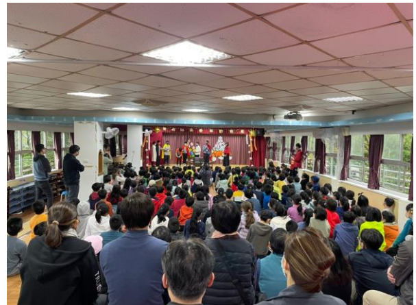
全校親師生全神貫注欣賞畢業生的演出