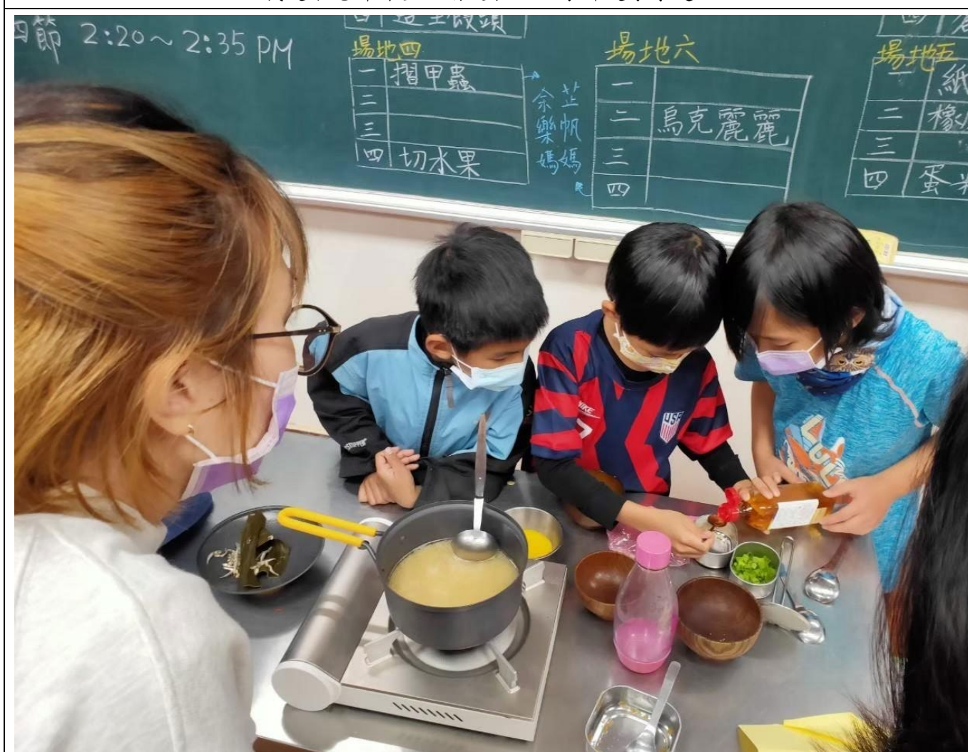
孩子們學習進行烹飪