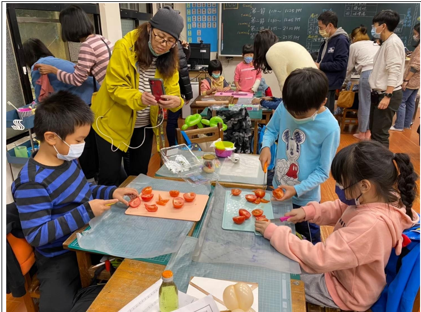
我是小老師課堂活動過程，大家都是家事達人