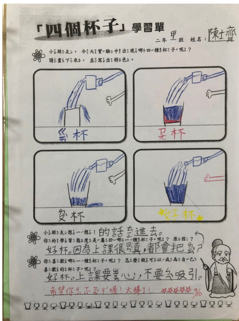
四個杯子故事學習單