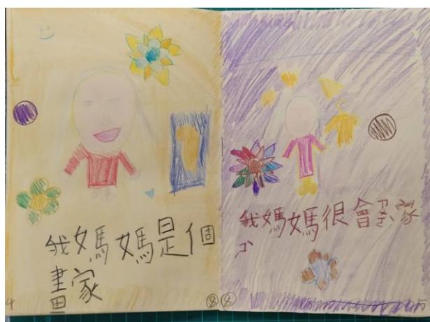
◆學生製作的媽媽小書成品