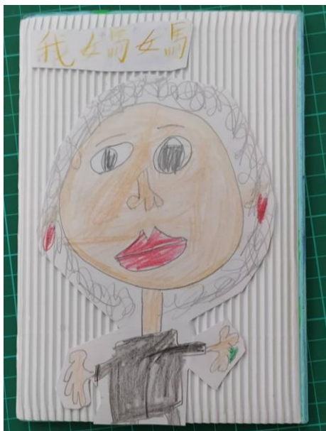
◆學生製作的媽媽小書成品