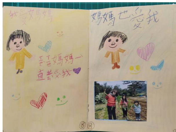
◆學生製作的媽媽小書成品