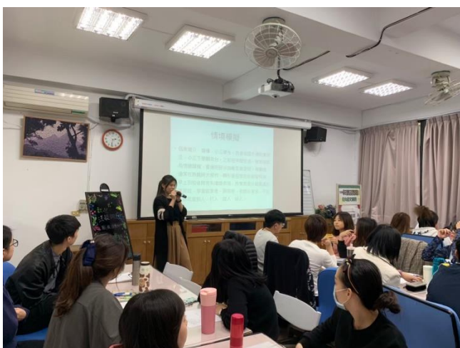
◆參與研習的教師們專心聆聽。