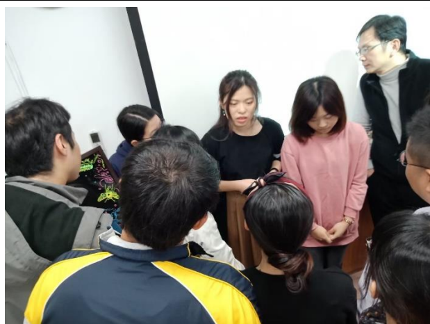
◆講師說明個案特質以利情境模擬練習。