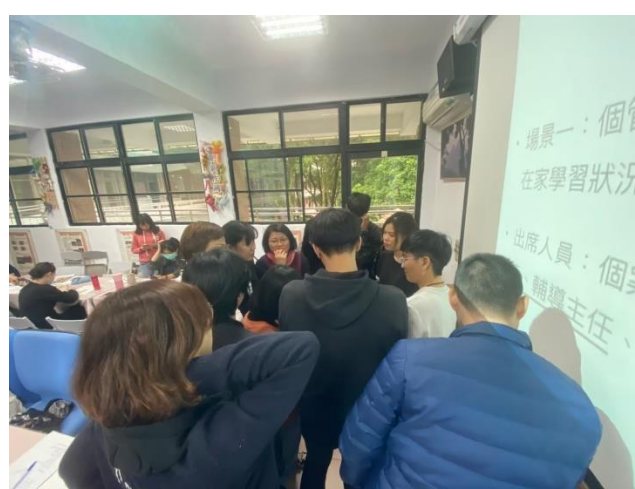
◆老師們進行案例分析與討論。