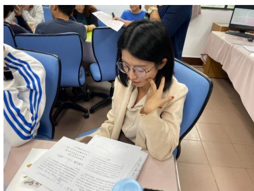
◆特教教師分享特教班學習障礙學生實例。