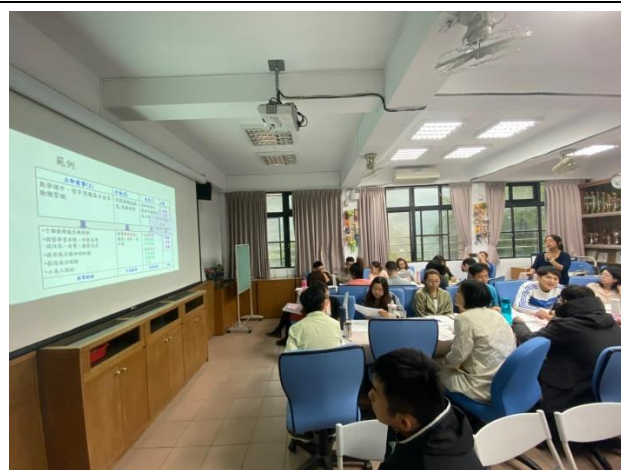
◆陳教授以常見學習障礙學生類型進行案例介紹。