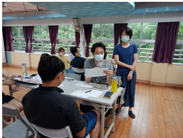
◆老師發表意見參與討論。