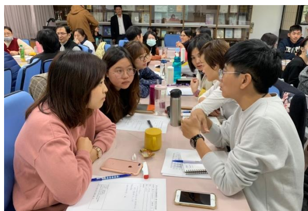
◆老師分享班級實務經驗，討論策略應用。