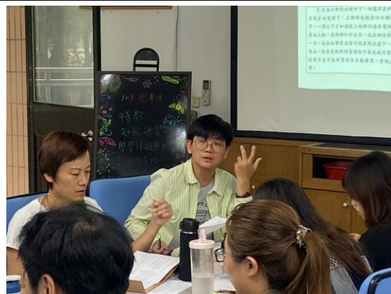
◆老師分享班級實務經驗，討論策略應用。