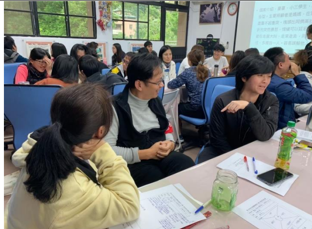
◆老師們進行個案討論。