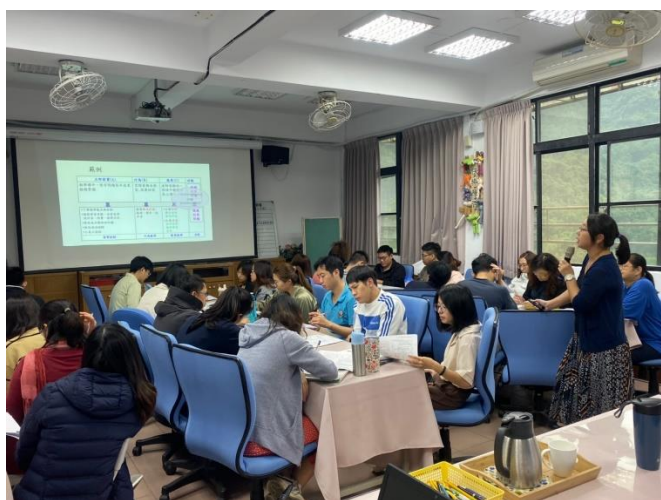
◆參與研習的教師們專心聆聽。