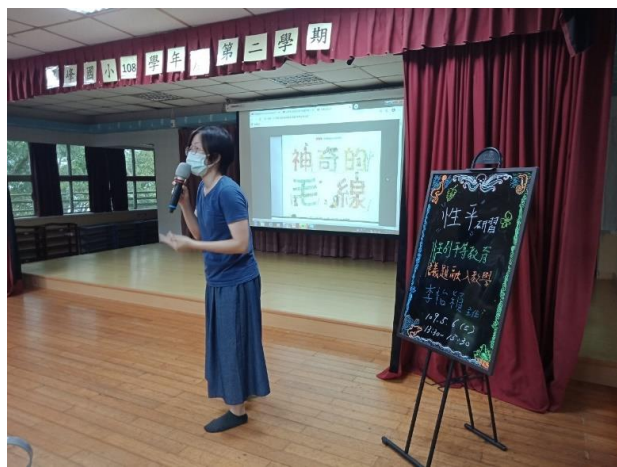
◆邀請助教練芳好老師分享領域教案。