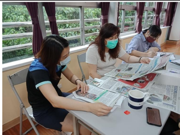
◆參與研習的教師們從報紙媒體上找性平議題